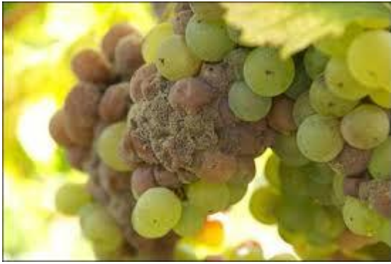
Druvor angripna av botrytis

Här kommer så tabellen på rekommenderade viner att handla hem, så att du har ett litet lager.